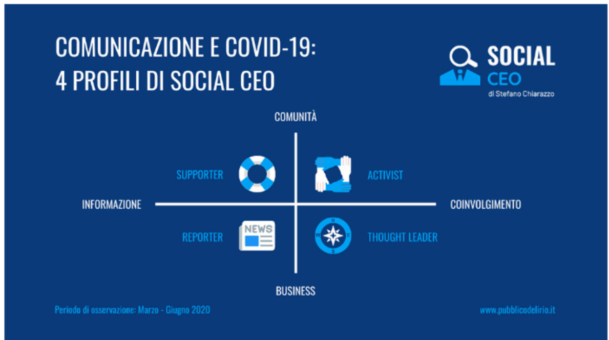
Grafico che mostra i quattro stili di comunicazione adottati dai top manager sulle piattaforme di social network (immagine: Pubblico Delirio)